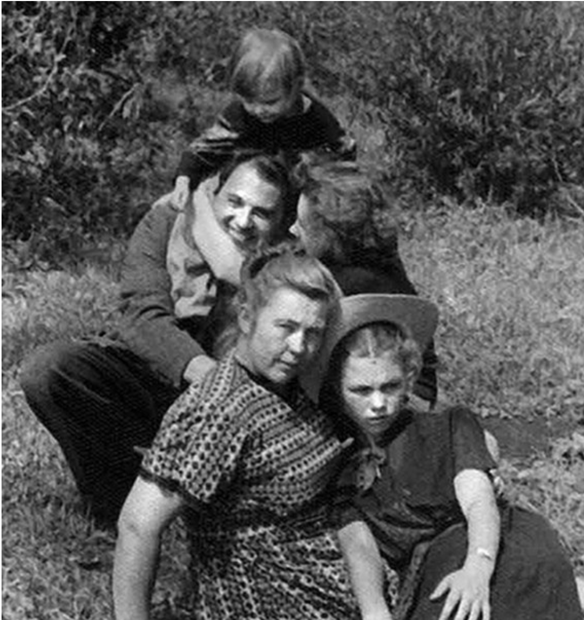
Foto: Michail Gorbatschow mit seiner Frau und ihre Verwandten in früheren Jahren im Urlaub