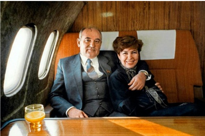
Foto: Michail Gorbatschow und Raisa Gorbatschowa

Gorbatschow ist Witwer. Er war glücklich verheiratet. Seine Frau, Raisa Gorbatschowa (1932-1999), war an sozialen und karitativen Aktivitäten beteiligt. Raisa Gorbatschowa war am 20. September 1999 vorzeitig an einer der schwersten Formen der Leukämie gestorben. Sie wurde im Nowodewitschi-Friedhof in Moskau beigesetzt.